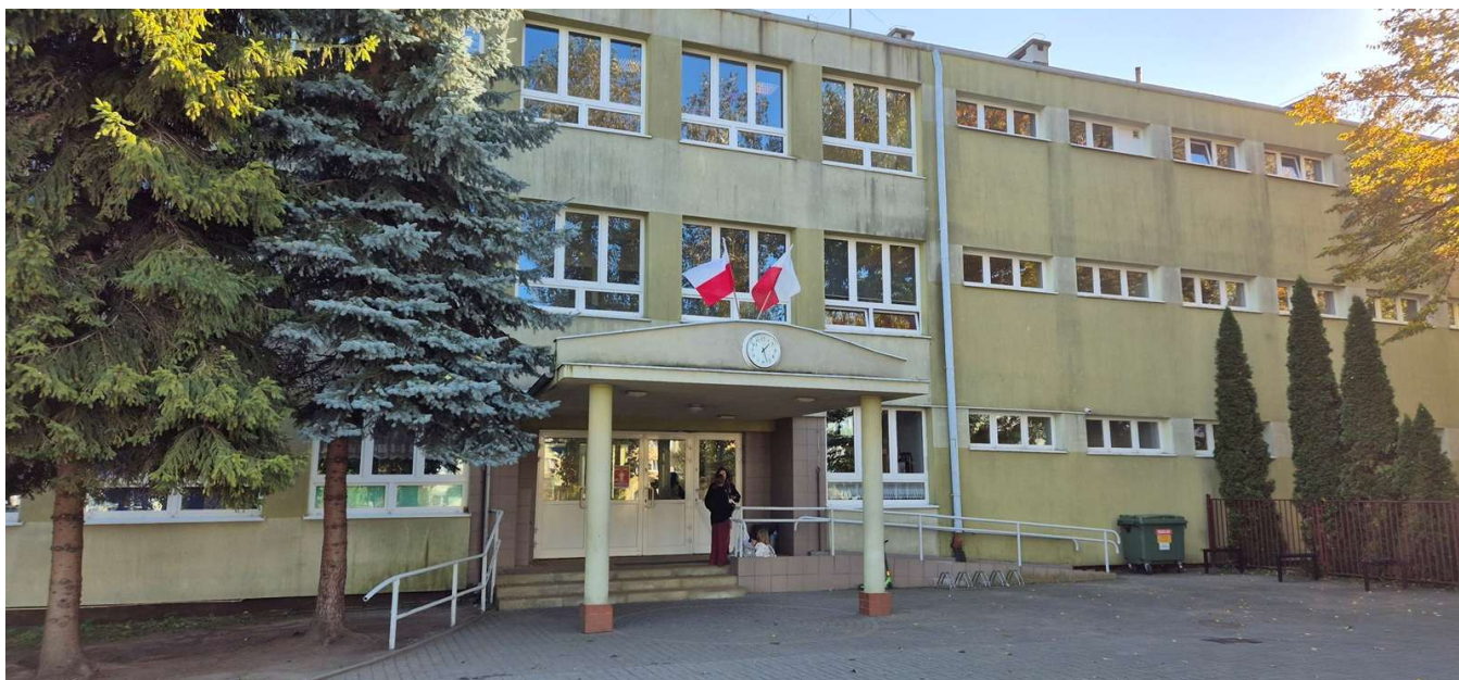
Rysunek 2 Front szkoły