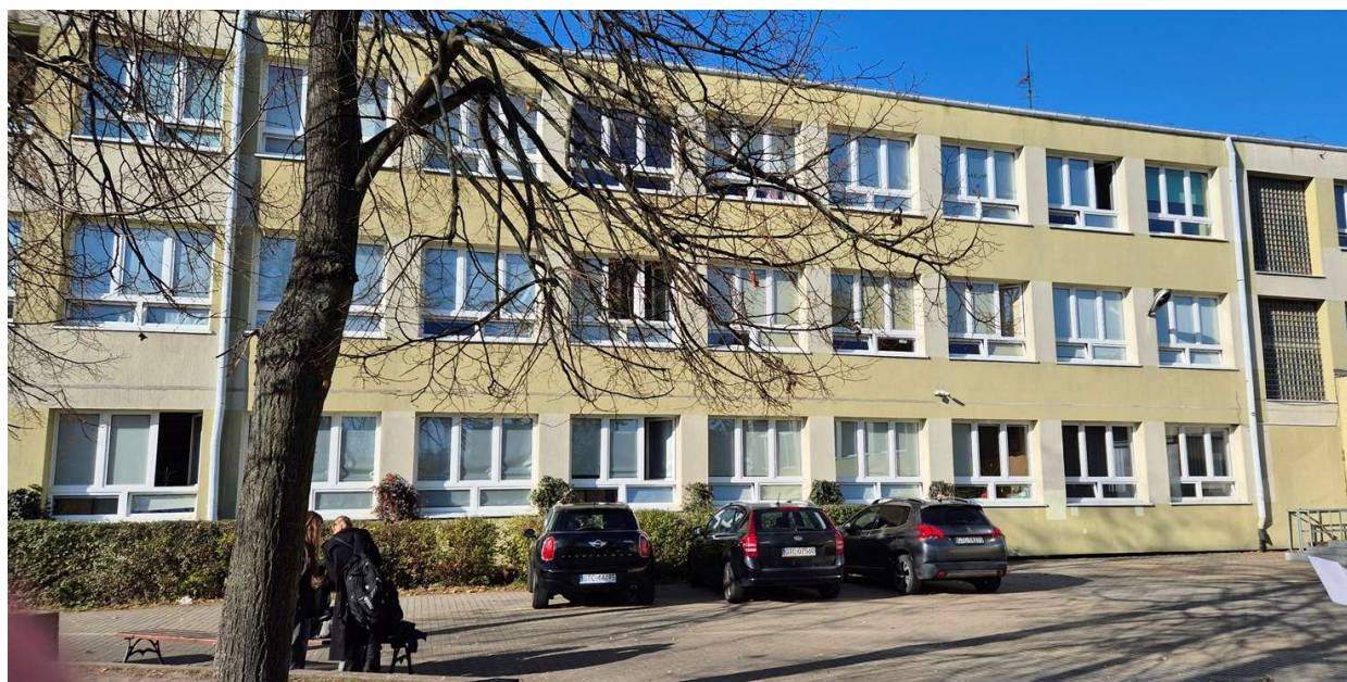
Rysunek 1 Widok szkoły

Budynek Szkoły Podstawowej nr 11 przy ul. Saperskiej wykonano jako budynek główny 3-kondygnacyjny z lat 60-tych oraz sala gimnastyczna połączona z budynkiem głównym łącznikiem oraz obudowana pomieszczeniami socjalnymi. Budynki wykonane z cegły, ocieplone styropianem o grubości 10cm, warstwa ocieplenia na budynku głównym ulega częściowej dewastacji na skutek znacznego zawilgocenia – źle wykonane orynnowanie powoduje zacieki wody pomiędzy warstwę izolacji i warstwę nośną ściany. Elewacja budynku w wielu miejscach zdewastowana. Stropodach budynku głównego wykonany z płyt typu żerańskiego, ocieplona warstwą styropapy. Stropodach nad salą gimnastyczną z pustką powietrzną. Okna i drzwi w stanie ogólnie dobrym, wykonane jako PCV, okna dwuszybowe, w elewacji budynku znajdują się także tzw. świetliki czyli luksfery, którą są nieszczelne i powodują wychłodzenie pomieszczeń. Ogrzewanie budynku z węzła ciepłowniczego, rozprowadzenie instalacją c.o. stalową, nieizolowaną, grzejniki stalowe płytowe, często bez zaworów termostatycznych i odcinających. Zasilanie c.w.u. z pompy ciepła.