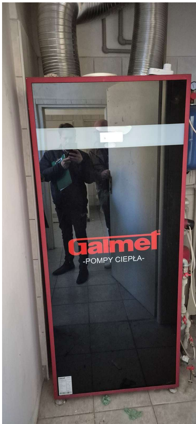
Rysunek 4 Pompa ciepła na potrzeby c.w.u.

Usytuowanie budynku w stosunku do stron świata